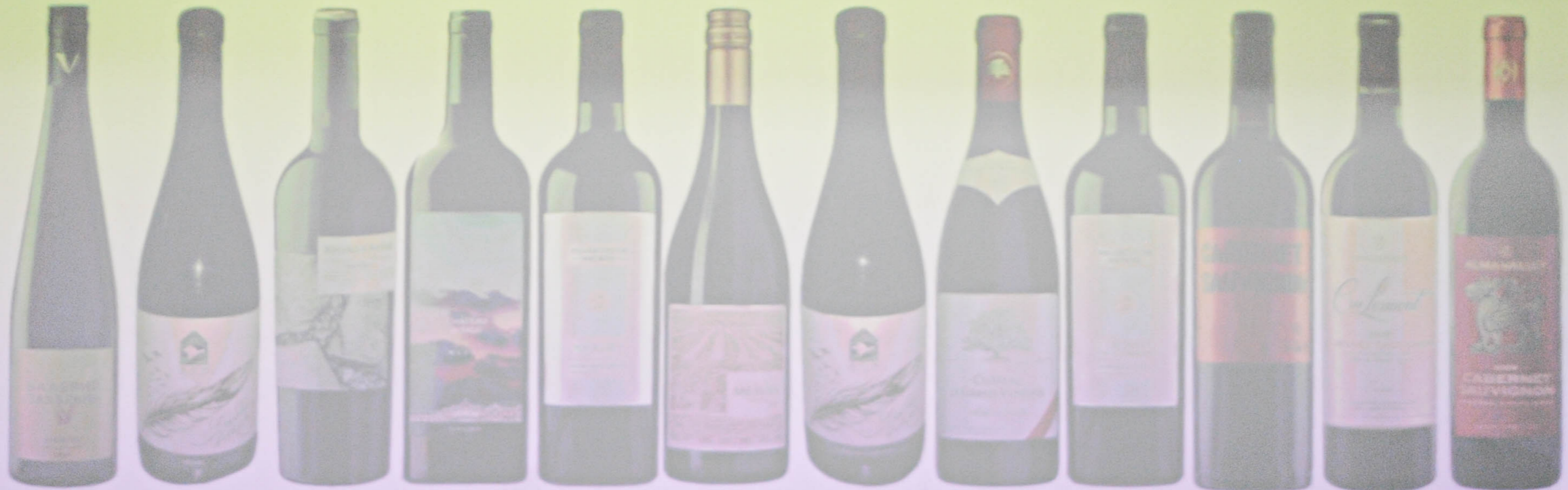
Валерий Захарын Мерло 2024